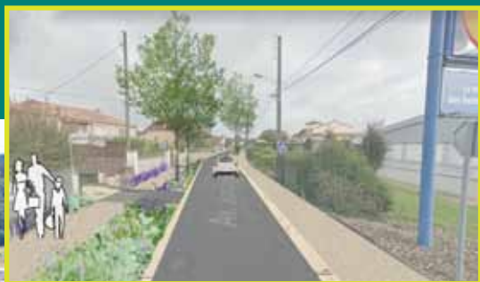
Aménagement de l'avenue Jean Jaurès