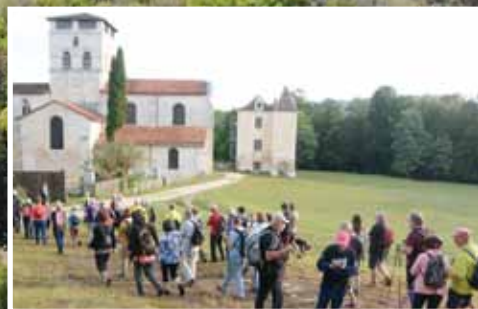
C'est le second lieu touristique majeur du Grand Périgueux