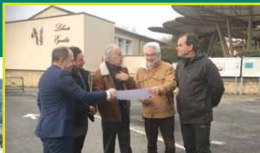
Avec le cabinet d'études pour apprécier les lieux et définir le projet