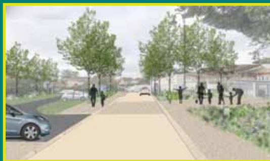
Aménagement de la sortie de l'école élémentaire