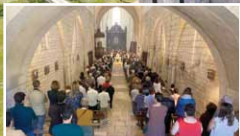
L'église abbatiale cadre prestigieux de concerts tout au long de l'année