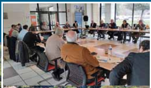
Première réunion du comité de pilotage de la zone d'aménagement différé de l'abbaye fin février 2023