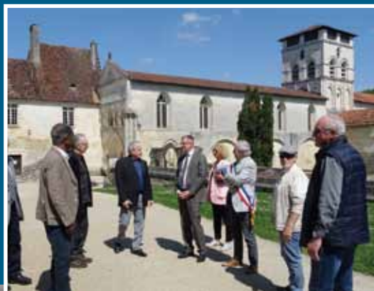
En avril 2022, rencontre avec Jean-Sébastien Lamontagne, préfet de la Dordogne